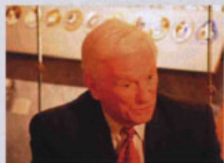
Capt. Eugene A. Cernan, Kommandant von Apollo 17, auf der OMEGA-Medienkonferenz anlässlich der Baselworld 04 im April 2004. Bemerkenswert war sein Statement bezüglich der OMEGA Speedmaster Professional, derjenigen Uhr, welche ihn 1972 auf den Mond begleitet hat: "Sie war mein Fenster zur Realität meiner wirklichen Welt (zuhause)."

Am 7. Dezember 1972 wurde mit dem Start von Apollo 17 das vorerst letzte Kapitel in der bemannten Erforschung des Mondes aufgeschlagen. An Bord die Astronauten Capt. Eugene A. Cernan, Harrison H. Schmitt und Ronald Evans.