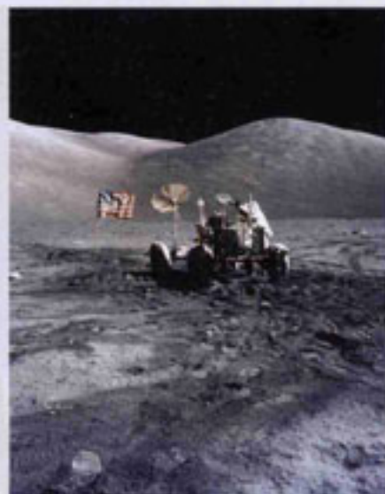
Cernan auf dem Weg zu Station 6. Zu sehen am hinteren rechten Rad ist das aus einer Mondkarte selbstgebastelte Schutzblech - die erste Autoreparatur auf dem Mond.

später durch den Einschlag eines Meteoriten an die Oberfläche des Mondregolithen befördert und haben daher nichts mit der Kraterbildung an sich zu tun. Trotz Enttäuschung eine aufschlussreiche Entdeckung.